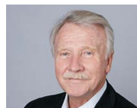
Ilmar Reepalu (S)* Delegationsordförande Malmö stad